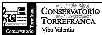
TABELLA B - TITOLI DI STUDIO, ARTISTICI, CULTURALI E PROFESSIONALI (punteggio massimo: 18 punti)